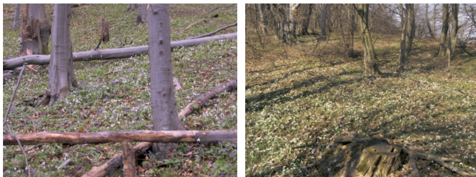
Fot. 2. Przykładowe siedliska śnieżyczki przebiśnieg – buczyna i grąd.