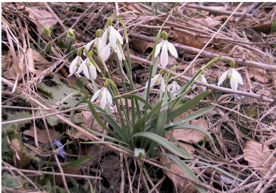
Fot. 1. Śnieżyczka przebiśnieg Galanthus nivalis.